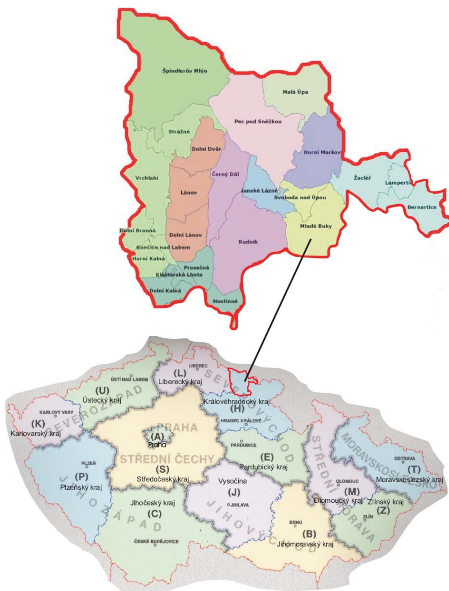
Mapa – území působnosti MAS Krkonoše

Území MAS se nachází v centrální části turistického regionu Krkonoše a mezi významná centra oblasti patří města Vrchlabí, Hostinné, Pec pod Sněžkou, Špindlerův Mlýn a řada dalších měst a obcí. Území MAS zaujímá cca. 485,25 km 2 , a žije zde 40 098 obyvatel (údaj k 31.12.2006).