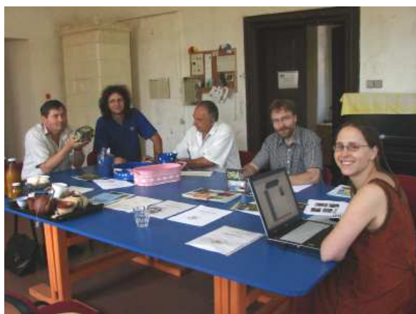
Certifikační komise 2.7.2008