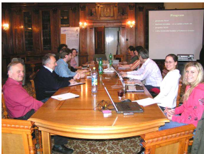
Členská schůze 28.2.2008

Členy Rady sdružení, výkonného orgánu MAS, byli v roce 2008: