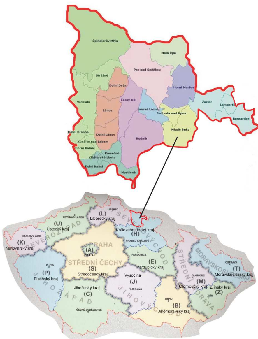
Mapa – území působnosti MAS Krkonoše

MAS Krkonoše sdružuje celkem 24 obcí na území Královéhradeckého kraje, okresu Trutnov, v rámci NUTS II Severovýchod. Nachází se v centrální části turistického regionu Krkonoše a mezi významná centra oblasti patří města Vrchlabí, Hostinné, Pec pod Sněžkou, Špindlerův Mlýn a řada dalších měst a obcí. Území MAS zaujímá cca. 485,25 km 2 , na kterém žije kolem 40 278 obyvatel (údaj k 31.12.2007).